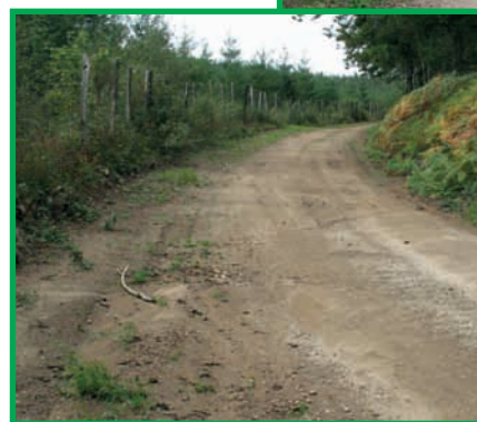
Chemin de Caraman