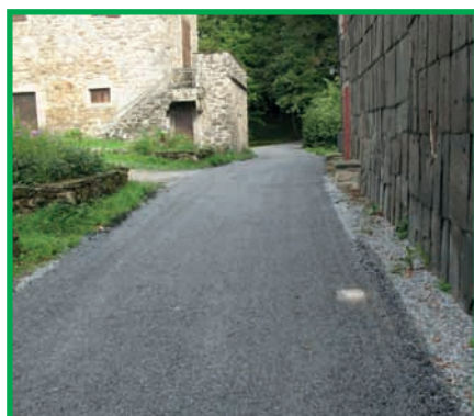
Chemin de Vergougnac