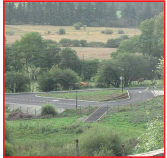
Aire de camping-car

Pour rappel ce projet a été subventionné à hauteur de 70 % ; il complète et finalise l'aménagement du pourtour du lac.