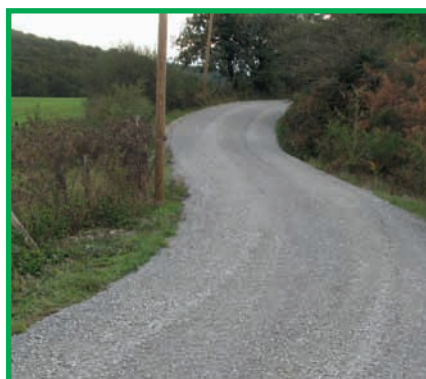
Chemin de La Fajole