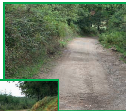
Chemin des 7 Faux

Le Conseil départemental a notifié à la commune un financement de 14900 euros. L'Etat participe à hauteur de 4470 euros . Le Conseil régional apporte une aide de 3241,50 euros.